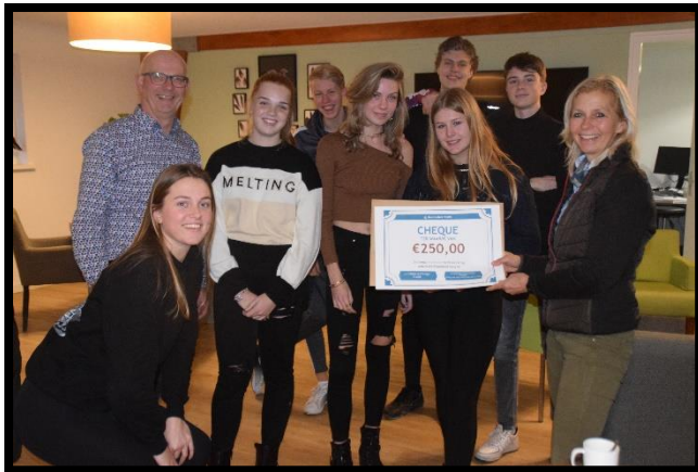
Het bezoek van het Don Bosco College werd afgesloten met een donatie van de leerlingen aan Wings of Change